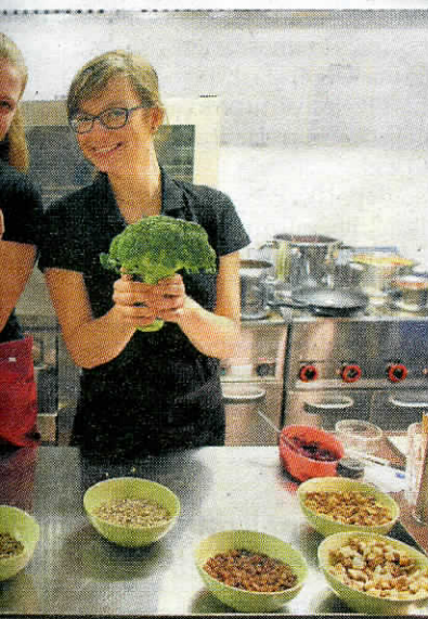
we, kolorowe, dobrze przyprawione

bio- tecy- a sta- opo- y, oli- oko- aną, oraz pio- ive”. i nas oleju tucz- ków, pro- naku rzez zna- praw- oiera rych ywa- rzez e ma- ka. e zu- któ- raźjemy za 8 zł. Codziennie inne są też dania główne, a wśród nich takie przysmaki jak warzywa sos- us- vide, curry, knedle jaglane, buchty z sosem owocowym, a nawet burger z kaszy jaglanej. Ceny dań wahają się od kilku do kilkunastu złotych.